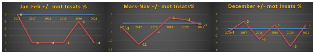
Diagram 2 i mitten med Mars – November innehåller varje år minst 50 V75-omgångar.

Nästa uppgift är alltså att täppa till januari-februari-hålet och det här gör att vi fram till sista omgången i februari i Speedanalysen kommer fortsätta med nya Sko-kolumnen .